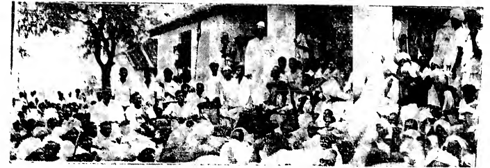
గత మాసం మునగాల ఏప్రిల్ గ్రామంలో అధ్యక్షులు రంగాడు సంచారు చేసినప్పటి ఒక దృశ్యం. మునగాల రైతులకు-రాజాగారికి మధ్య జరిగిన ఒడంబడికలోని షరతులు రైతులచే చాలామటు పాటించబడినా, రాజాగారిచే పాటించబడక పోవడంవల్ల దుడుచుబిస్తున్న వీర్యులకు, రైతులు సత్కారాలను నిశ్చయించు కొన్నారు.

Raja Muthiah Research Library 3rd Cross Road, C.P.J. Campus, Taramani, Chennai - 600 113, India.